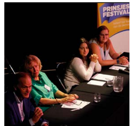
Het panel, PrinsjesBurger 2023